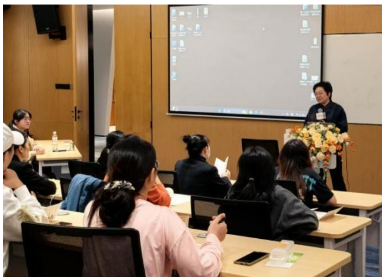
追光人训练营线下培训现场

在全民阅读立法与家庭教育促进法深入实施的双重背景下，儿童阅读推广正呼唤兼具专业素养与时代传播力的新生力量。为此，爱阅公益于本季度创新发起了“追光人创造营”阅读推广人成长行动，旨在探索并培育一批善用新媒体、深耕社区实践的阅读推广“追光人”。该活动成功集结了超过 1000 名来自全国各地的阅读推广志愿者及热心家长。他们在小红书平台以 #追光人创造营 为阵地，发布了 300 余篇生动实用的亲子阅读笔记，并自发组织落地了超过 100 场社区及线下阅读活动，相关话题累计收获 6.8 万次用户浏览与 1.2 万次深度互动。