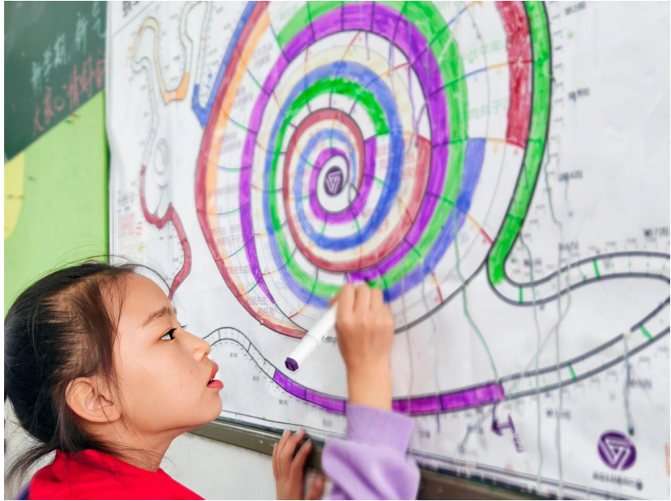
《年终回顾 | 原点2024年度四个关键词》

2025年1月，原点教育公益发布2024年年终回顾，2024年是原点乡村学校计划立项的第五个年头。这一年，原点各项活动共支持学校61所，教师366人次，学生9,569人次。原点团队从这一年的经历中凝炼出四个关键词，分别是“常规”、“凝聚”、“成长”、“看见”。