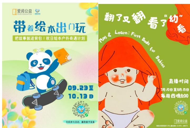
( 推广活动海报 )

本季度，关于小程序运营推广共发布 10 篇推广文章，总阅读量超 7739 次，为小程序的传播与用户增长提供了有力支持。