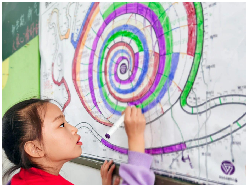
《年终回顾 | 原点 2024 年度四个关键词》

2025 年 1 月，原点教育公益发布 2024 年年终回顾，2024 年是原点乡村学校计划立项的第五个年头。这一年，原点各项活动共支持学校 61 所，教师 366 人次，学生 9,569 人次。原点团队从这一年的经历中凝炼出四个关键词，分别是“常规”、“凝聚”、“成长”、“看见”。