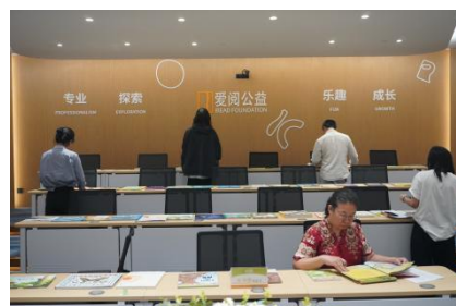
2024年生态童书60评选花絮留念照