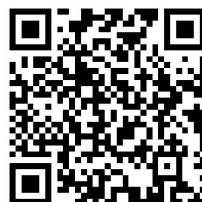
2024年生态童书60入选图书

项目组进行收集、整理及采购评选图书、邀请并接待评委老师，于3月30日完成了2024年生态童书60的评选工作，其中3-6岁、6-9岁、9-12岁年龄段各20本图书。