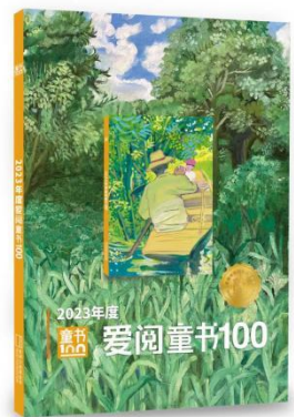
2023 年度爱阅童书 100 书目手册

对、印制工作，书目手册运用于 2023 年度爱阅童书 100 发布会及日后其他相关活动。